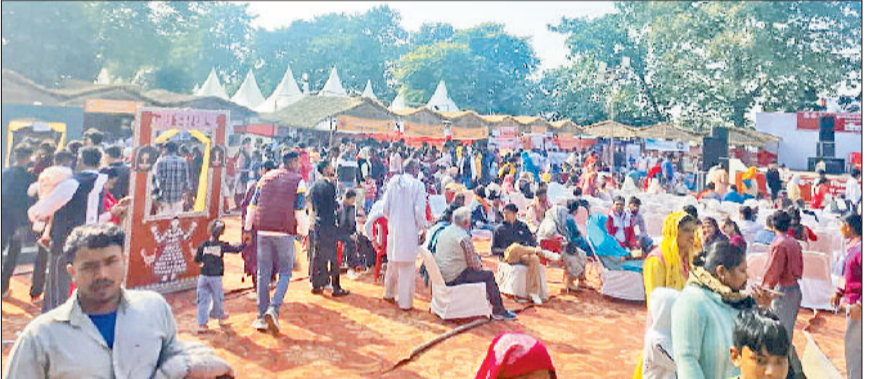
कुरुक्षेत्र। हरियाणा पवेलियन में उमड़ी पर्यटकों की भीड़।

हरियाणा की समृद्ध लोक परंपराओं, लोककला, पारंपरिक वस्त्रों, ग्रामीण जीवनशैली और सांस्कृतिक धरोहर को देखने के लिए पवेलियन में भारी संख्या में दर्शक उमड़े