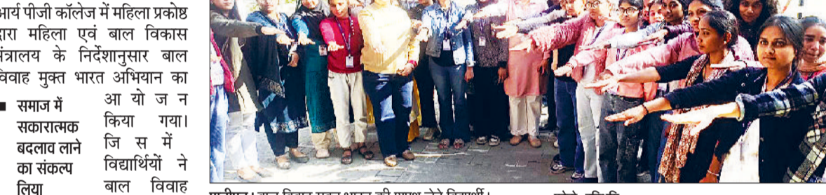
पानीपत। बाल विवाह मुक्त भारत की शपथ लेते विद्यार्थी।