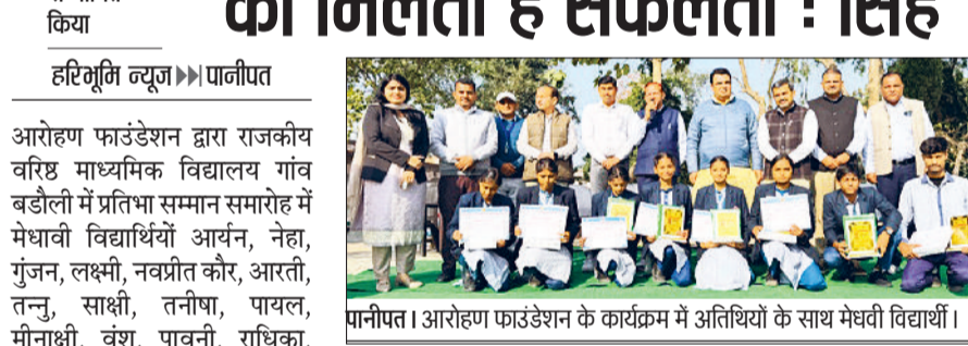
पानीपत। आरोहण फाउंडेशन के कार्यक्रम में अतिथियों के साथ मेधवी विद्यार्थी।