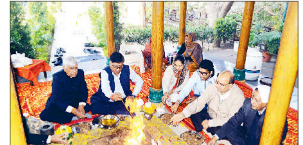
मार्गशीर्ष पूर्णिमा पर श्री कृष्ण गो शाला में हुआ हवन