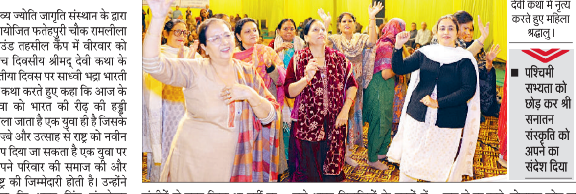
पानीपत। श्रीमद् देवी कथा में नृत्य करते हुए महिला श्रद्धालु।