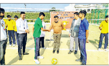
तरावड़ी। प्रताप पब्लिक स्कूल तरावड़ी के खेल परिसर में इंटर-हाउस वॉलीबॉल मैच का सफलतापूर्वक आयोजन किया गया।