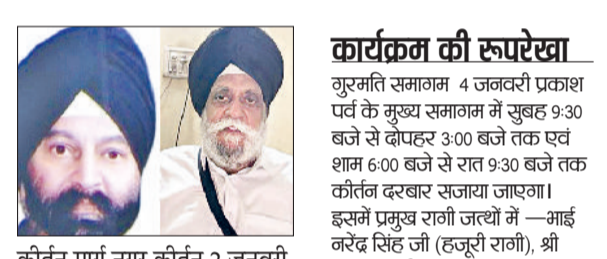
कीर्तन मार्ग नगर कीर्तन 2 जनवरी, शुक्रवार को गुरुद्वारा डेरा कार सेवा एवं गुरुद्वारा मंजी साहिब पातशाही पहली से सुबह 10:30 बजे आरंभ होगा। यह कर्ण गेट, सब्जी मंडी चौक, कुंजपुरा रोड, अस्पताल चौक, सेक्टर 12, निर्मल कुटिया, गुरुद्वारा सेक्टर-7, गुरुद्वारा बाबा कश्मीर सिंह सेक्टर-6, मेरठ रोड, डी.सी. कॉलोनी, महाराणा प्रताप