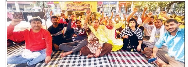
अनुबंध कर्मचारियों ने दायर की हाईकोर्ट में याचिका