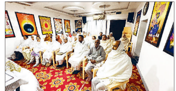
तरावड़ी। कार्यक्रम में उपस्थित ब्रह्माकुमारी ईश्वरीय विश्वविद्यालय के भाई बहन।

विमुख हो गये। हमने अपने में शक्तियां भरी या दूसरों को देखते हुए हम भी अलबेले हो गये। यदि हमने ये भाग्य बनाने के दिन यूँ ही बिता दिये होंगे तो हमें पश्चाताप के सिवा कुछ भी नहीं मिलेगा तो आइये, स्वयं से बाते करें, मेरा एक-एक क्षण बहुत मूल्यवान है और मेरा एक-एक संकल्प बहुत ही महान है, भाग्य निर्माता है, जन्म-जन्म के लिए मुझे एनर्जी देने वाला है।